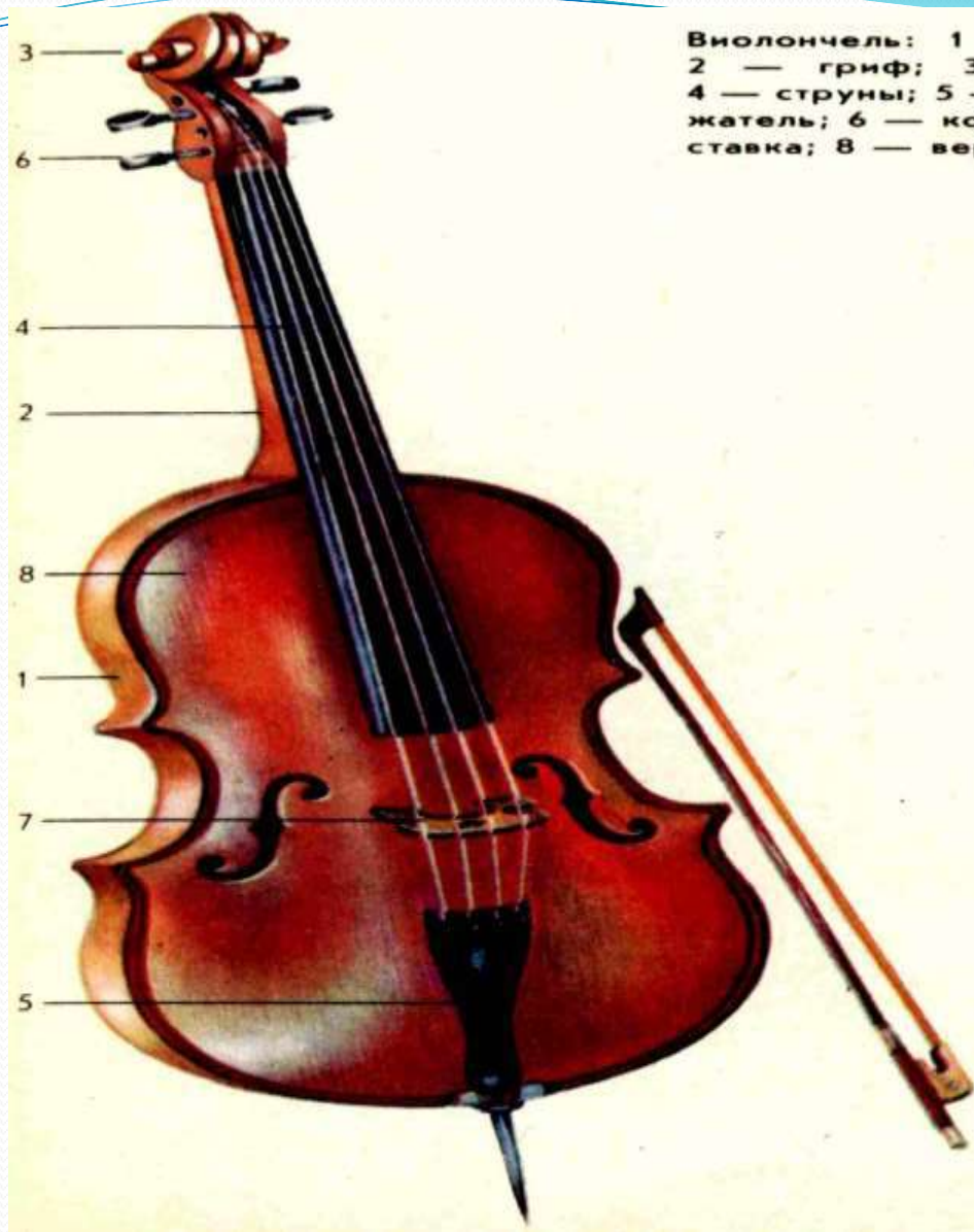
Виолончель: 1 — обечайка; 2 — гриф; 3 — головка; 4 — струны; 5 — струнодер- жатель; 6 — колки; 7 — под- ставка; 8 — верхняя дека.